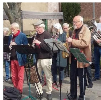
9.30 startar Röda Kapellet mötet med "Första Maj".